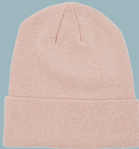
Boreal Recycled Cotton