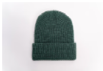
Pigment Alpine Green