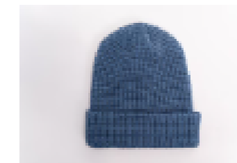
Pigment Slate Blue