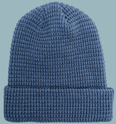
Leery Waffle Acrylic