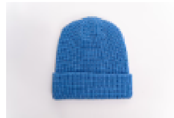
Pigment Light Blue